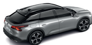
Šedá ARTENSE (M)