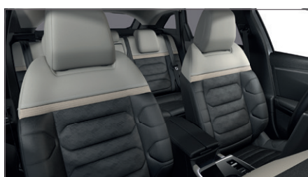
INTERIÉR HYPE ADAMANTIUM Kůže černá / Kůže Adamantium s perforováním se vzorem složeným z log CITROËN