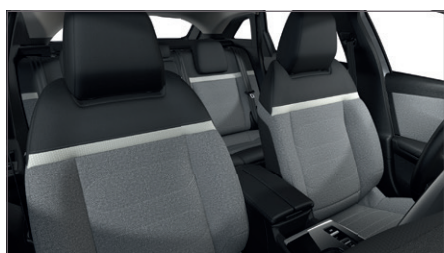
STANDARDNÍ INTERIÉR Látka CHEVRONS Šedá / Látka černá