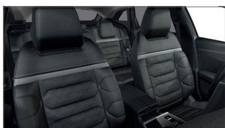
ČERNÝ INTERIÉR HYPE Kůže černá s perforováním se vzorem složeným z log CITROËN