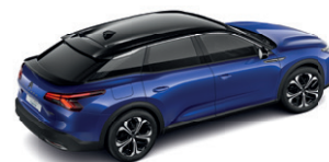
Modrá ECLIPSE (M)