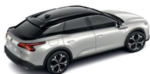
Bílá PERLE NACRE (P)