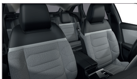
ŠEDÝ INTERIÉR URBAN Látka CHEVRONS Šedá / Látka černá s efektem kůže