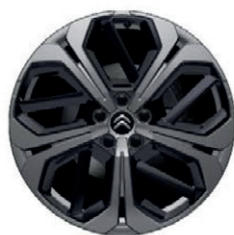
Hliníkový disk Aero X R19