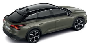
Šedá AMAZONITE (M)