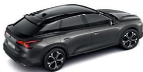
Šedá PLATINIUM (M)

(M) : metalický lak - (P) : perleťový lak