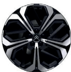
Hliníkový disk Aero X černé broušené R19