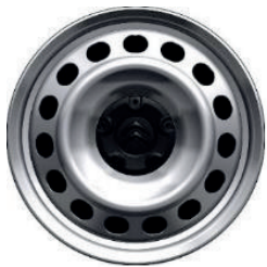
Kryt středu kol