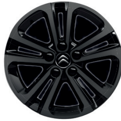
Hliníkový disk (celo-černý) STARLIT R16